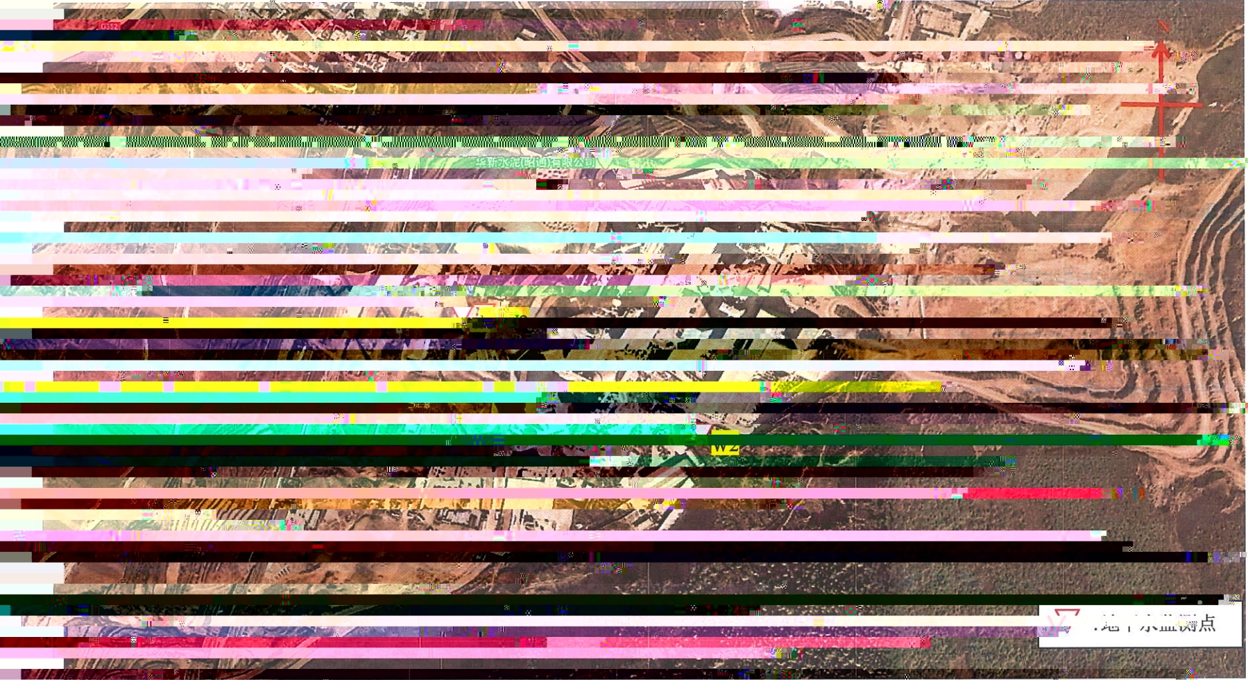
华新水泥(昭通)有限公司 2023 年第二季度自行监测点位图