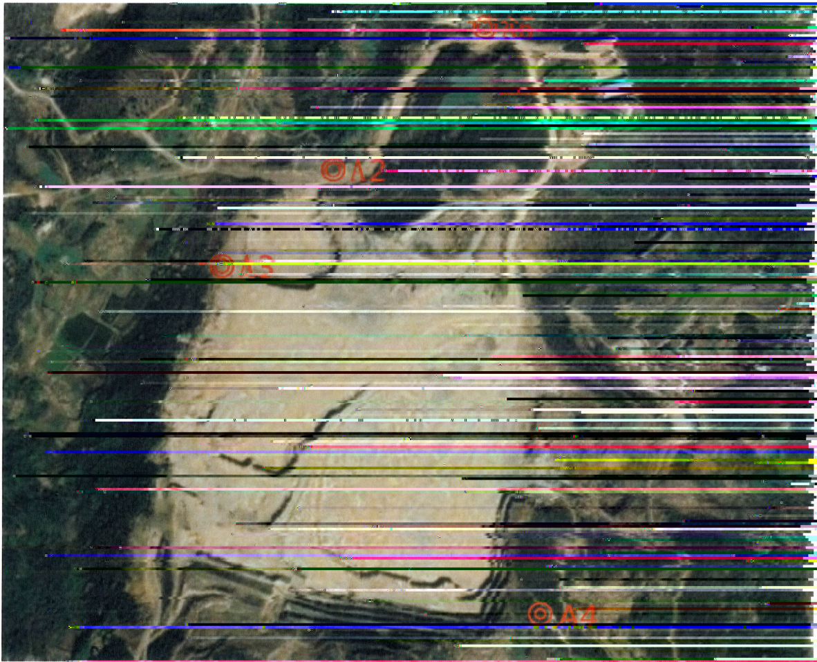
附图 1: 无组织废气检测点位示意图