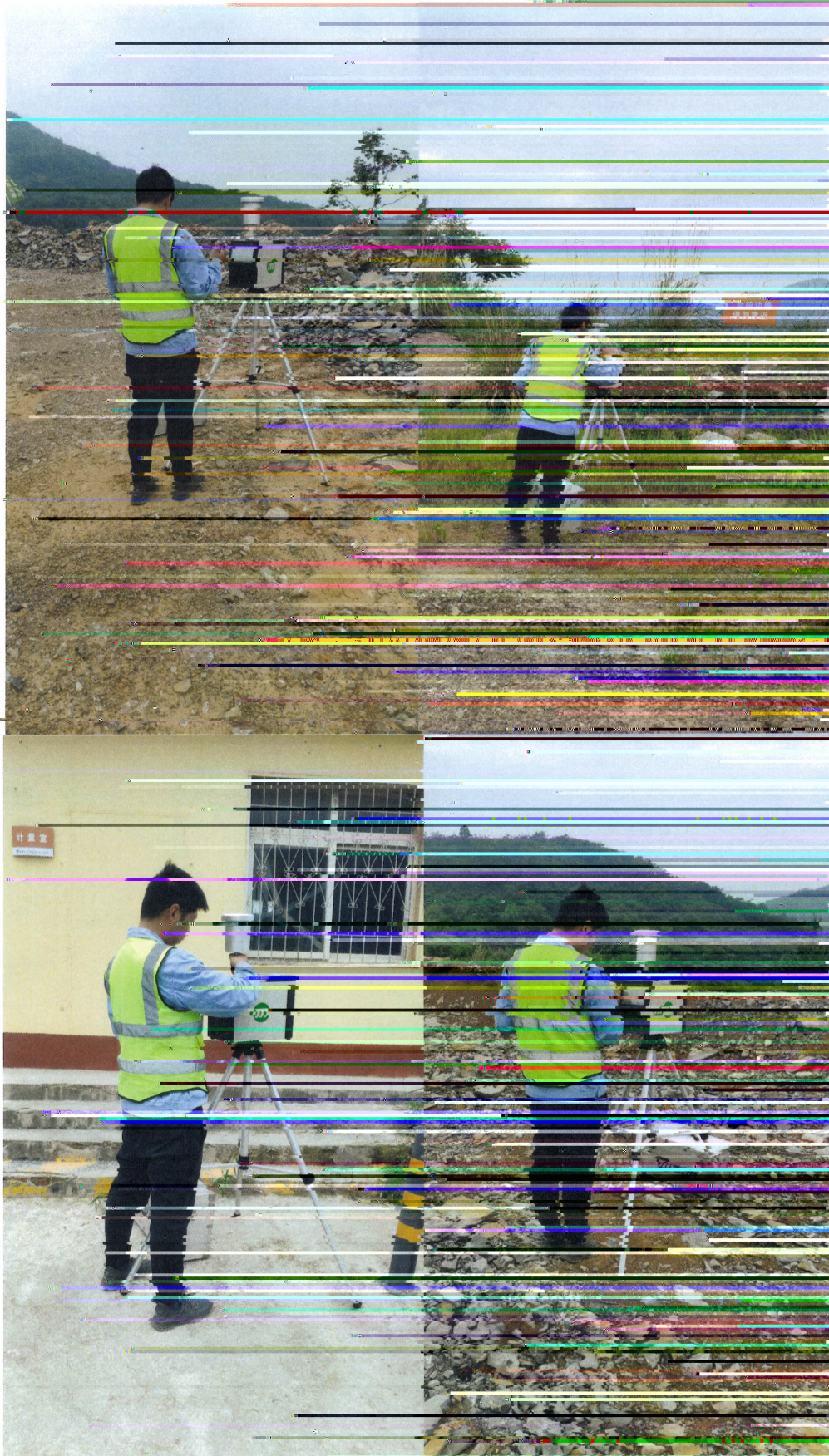
附图 2: 现场采样图